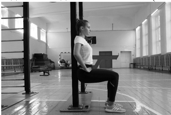
Рисунок 4 – Схема выполнения упражнения

Внимание: Тест необходимо завершить при появлении тремора, и попытках изменить позу (непроизвольные движения), ощущения жжения в мышцах ног (со слов испытуемого) и обязательно оказать помощь испытуемому при выходе из исходного положения. (Рисунок 4).