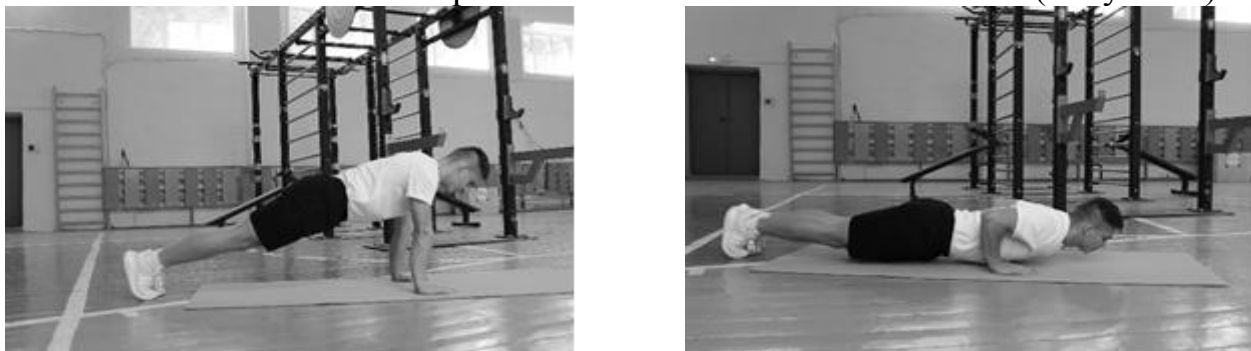
Рисунок 2 – Схема выполнения

Сгибание и разгибание от пола из исходного положения – упор лежа, руки располагаются на ширине плеч (кисть под плечом). Необходимо при сгибании и разгибании рук в локтевом суставе сохранять туловище прямым (голова, плечи, таз одна линия). При сгибании рук (угол сгибания в локтевом суставе более 90^\circ , угол отведения плеча не более 45^\circ ) грудь приближать к полу на расстояние 7-8 см. при нарушении техники тест прекращается, засчитывается количество правильно выполненных отжиманий. (Рисунок 2)