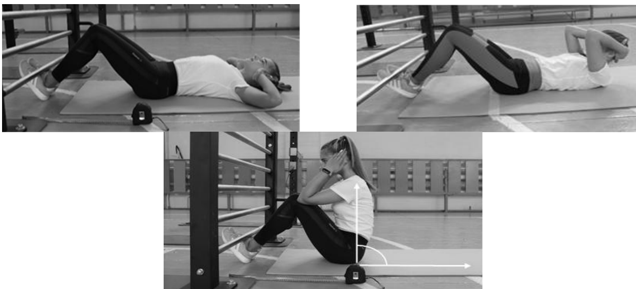
Рисунок 1 - Схема выполнения

Поднимание туловища выполняется на гимнастических матах из положения лежа на спине руки за головой, локти разведены в стороны, касаются гимнастического мата, ноги согнуты в коленных суставах под углом 90 градусов, ступни ног прижаты партнером к полу. По команде «Марш!» учащийся выполняет максимальное количество подъемов туловища за 1 мин, касаясь локтями бедер (коленей), с последующим возвратом в И.П. до касания лопатками гимнастического мата. Учитывается количество подъемов за 60 сек. (Рисунок 1).