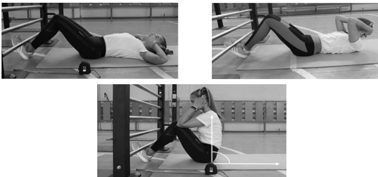
Рисунок 1 - Схема выполнения