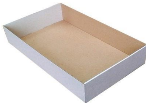
рис.1 Коробка для имитации сцены (пример)

Участники должны использовать все выделенное время для выполнения задания.