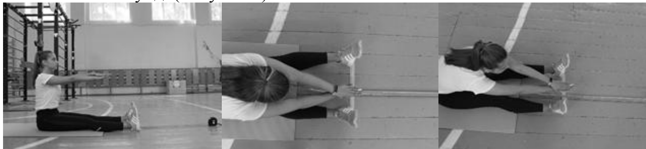
Рисунок 3 – Наклон вперед из положения сидя на полу

середины - перпендикулярно располагается рулетка отметкой 38 см, при этом нулевое значение находится на ближнем к тестируемому расстоянии. Тестируемый кладет одну ладонь на другую пальцы вместе, затем делает выдох и медленно наклоняется вперед. Результат определяют по касанию средними пальцами соединенных рук рулетки и удержание этого положения в течение 3х секунд. (Рисунок 3).