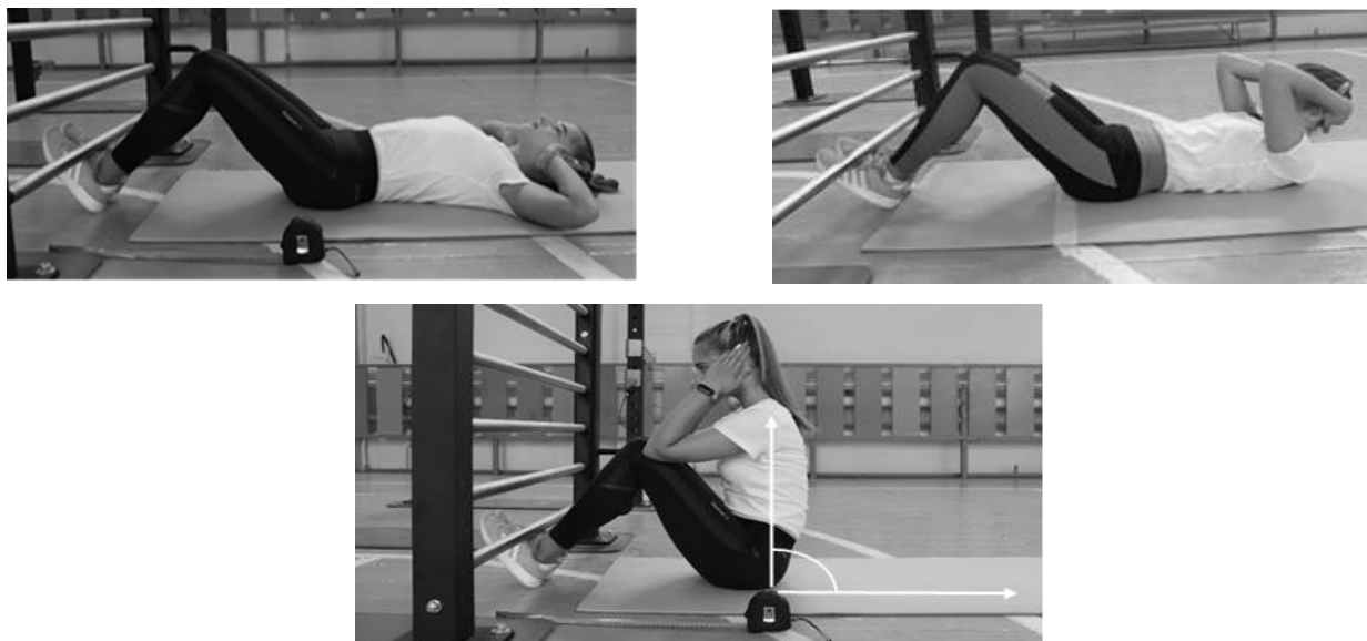
Рисунок 1 - Схема выполнения