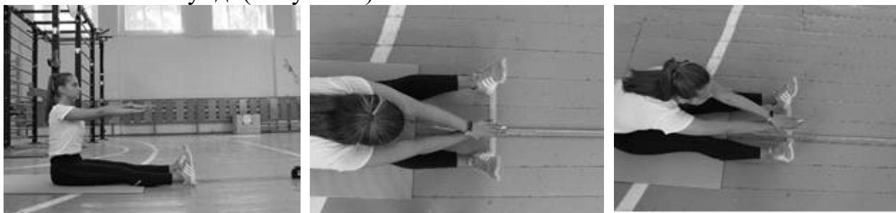
Рисунок 3 – Наклон вперед из положения сидя на полу

Тестируемый кладет одну ладонь на другую пальцы вместе, затем делает выдох и медленно наклоняется вперед. Результат определяют по касанию средними пальцами соединенных рук рулетки и удержание этого положения в течение 3х секунд. (Рисунок 3).