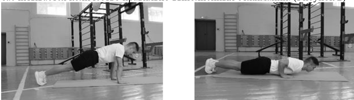
Рисунок 2 – Схема выполнения

Сгибание и разгибание от пола из исходного положения – упор лежа, руки располагаются на ширине плеч (кисть под плечом). Необходимо при сгибании и разгибании рук в локтевом суставе сохранять туловище прямым (голова, плечи, таз одна линия). При сгибании рук (угол сгибания в локтевом суставе более 90^\circ , угол отведения плеча не более 45^\circ ) грудь приближать к полу на расстояние 7-8 см. при нарушении техники тест прекращается, засчитывается количество правильно выполненных отжиманий. (Рисунок 2)