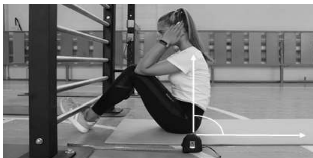
Рисунок 1 - Схема выполнения