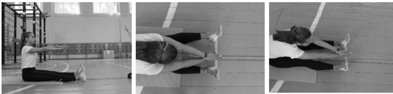
Рисунок 3 – Наклон вперед из положения сидя на полу