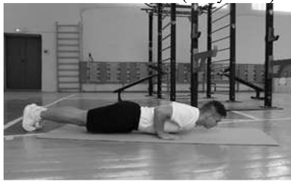
Рисунок 2 – Схема выполнения