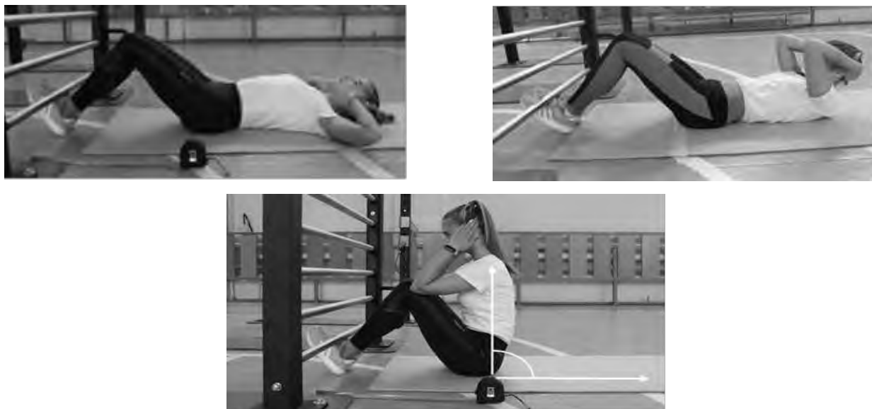
Рисунок 1 - Схема выполнения