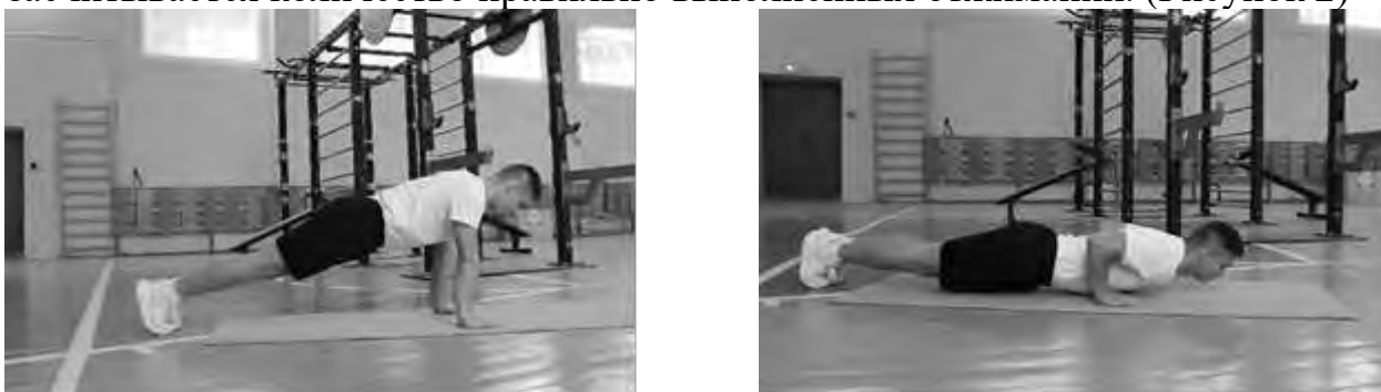
Рисунок 2 – Схема выполнения

Сгибание и разгибание от пола из исходного положения – упор лежа, руки располагаются на ширине плеч (кисть под плечом). Необходимо при сгибании и разгибании рук в локтевом суставе сохранять туловище прямым (голова, плечи, таз одна линия). При сгибании рук (угол сгибания в локтевом суставе более 90^\circ , угол отведения плеча не более 45^\circ ) грудь приближать к полу на расстояние 7-8 см. при нарушении техники тест прекращается, засчитывается количество правильно выполненных отжиманий. (Рисунок 2)