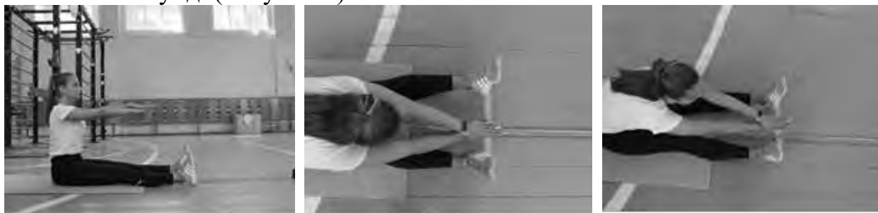
Рисунок 3 – Наклон вперед из положения сидя на полу

Тестируемый кладет одну ладонь на другую пальцы вместе, затем делает выдох и медленно наклоняется вперед. Результат определяют по касанию средними пальцами соединенных рук рулетки и удержание этого положения в течение 3х секунд. (Рисунок 3).