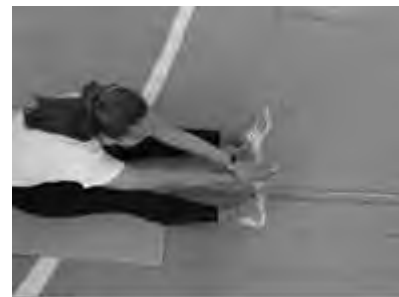
Рисунок 3 – Наклон вперед из положения сидя на полу