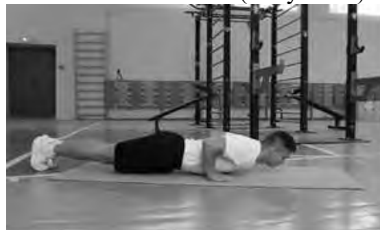
Рисунок 2 – Схема выполнения