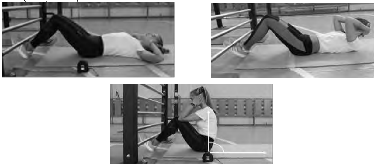
Рисунок 1 - Схема выполнения

Поднимание туловища выполняется на гимнастических матах из положения лежа на спине руки за головой, локти разведены в стороны, касаются гимнастического мата, ноги согнуты в коленных суставах под углом 90 градусов, ступни ног прижаты партнером к полу. По команде «Марш!» учащийся выполняет максимальное количество подниманий туловища за 1 мин, касаясь локтями бедер (коленей), с последующим возвратом в И.П. до касания лопатками гимнастического мата. Учитывается количество подъемов за 60 сек. (Рисунок 1).