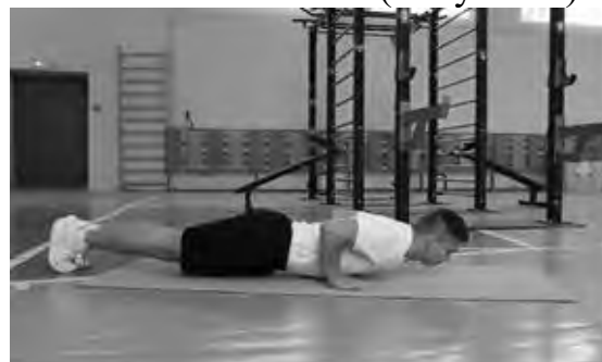
Рисунок 2 – Схема выполнения