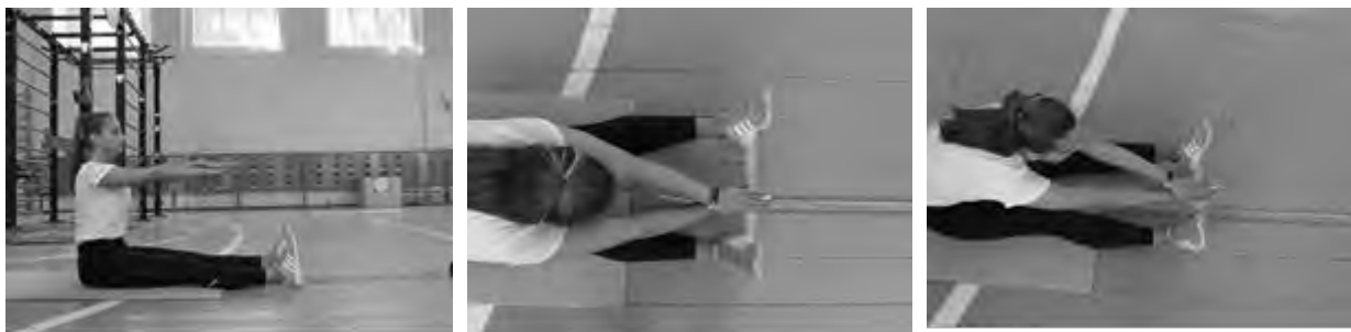
Рисунок 3 – Наклон вперед из положения сидя на полу