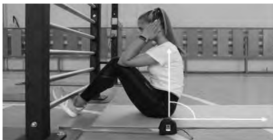
Рисунок 1 - Схема выполнения